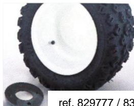
ref. 829777 / 830699

7989-14: Para mod. T y D 5989-13: Para mod. B y H 5989-14: Para mod. S 5989-15: Para mod. R