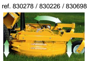
ref. 830278 / 830226 / 830698

5597: Rampa PVC para subir / bajar bordillos, etc... (se traslada sobre el plato de corte)