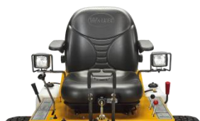
ref. 829344 / 830621 / 830697

7989-14/5989-13/5989-14: Kit de luces halógenas para trabajos en áreas de poca visibilidad o visión nocturna